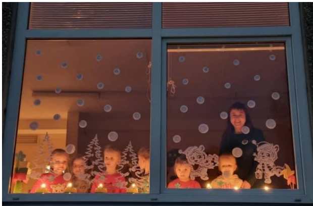
Radviliškio lopšelis – darželis „Eglutė“