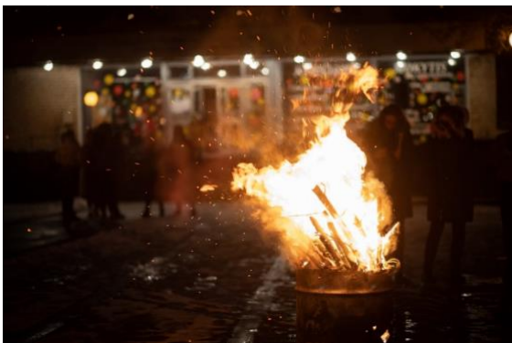
Šiaulių profesinio rengimo centro Buitinių paslaugų skyrius