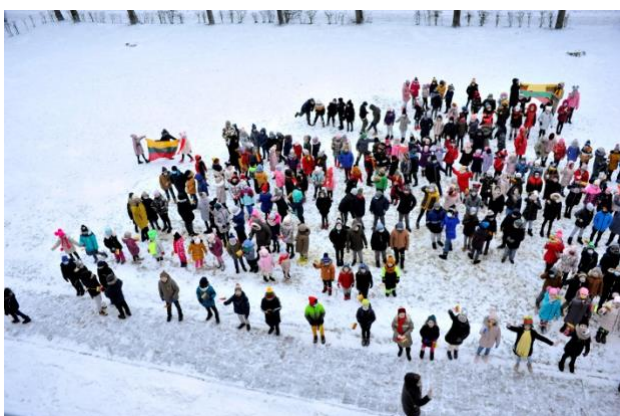
Zarasų Santarvės pradinė mokykla