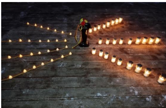
Vilniaus lopšelis – darželis „Pagrandukas“

Šiais metais pilietinė iniciatyva „Atmintis gyva, nes liudija“ Lietuvoje vyko jau penkioliktą kartą. 2022 metais prie iniciatyvos prisijungė daugiau nei 2000 Lietuvos švietimo įstaigų, valstybės institucijų, įstaigų ir organizacijų, atsiliepusių į Tarptautinės komisijos kvietimą.