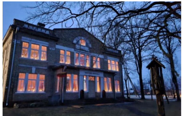
Joniškio rajono Gasčiūnų pagrindinė mokykla