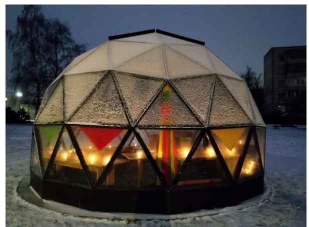
Vilniaus lopšelis – darželis „Pelėda“