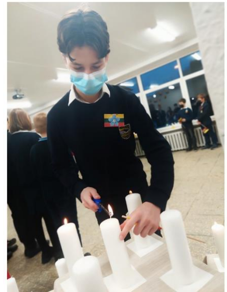
Vilniaus Ryto progimnazija

Palaikančių iniciatyvą skaičius pradėjo augti ir nuo 2014 metų – dalyvaujančių institucijų skaičius perkopė 1000. Jau keletą pastarųjų metų, iniciatyvoje „Atmintis gyva, nes liudija“ dalyvauja apie 2000 įstaigų, o šiais metais šis skaičius dar išaugo. Organizatoriai džiaugiasi, jog kasmet daugėja žmonių, kurie ir savo namuose, prisijungdami prie paminėjimo, uždega atminimo, vienybės ir pergalės žvakutes .