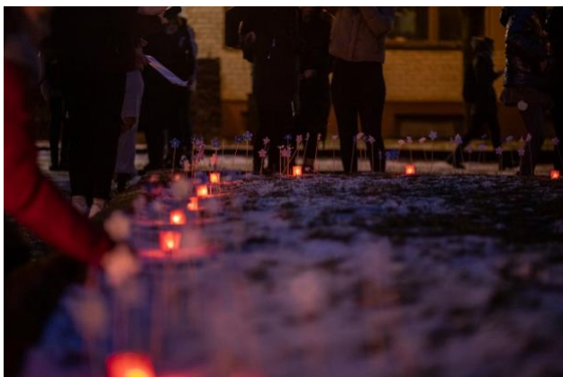
Šiaulių profesinio rengimo centro Butinių paslaugų skyrius

2008 metais Tarptautinė komisija pakvietė jungtis bendrojo ugdymo įstaigas prie iniciatyvos „Atmintis gyva, nes liudija“; idėją palaikė 47 Lietuvos mokyklos. Vėliau Tarptautinė komisija kreipėsi į įvairias institucijas ir organizacijas, kviesdama prisijungti prie idėjos – uždegti žvakutes languose dešimt minučių sausio 13 – osios rytą.