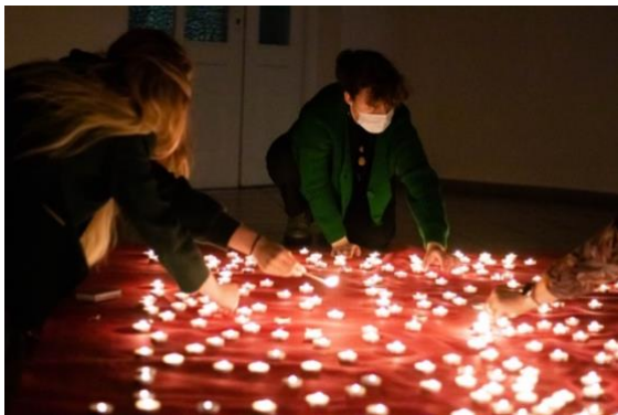
Klaipėdos „Ažuolyno“ gimnazija

Šiais metais pilietinė iniciatyva „Atmintis gyva, nes liudija“ Lietuvoje vyko jau penkioliktą kartą. 2022 metais prie iniciatyvos prisijungė daugiau nei 2000 Lietuvos švietimo įstaigų, valstybės institucijų, įstaigų ir organizacijų, atsiliepusių į Tarptautinės komisijos kvietimą.