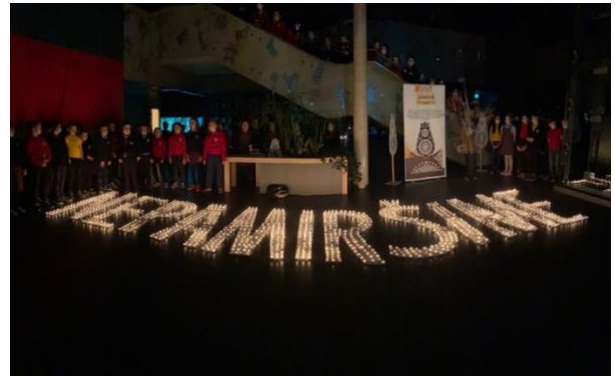
Vilniaus Balsių progimnazija

2022 metų sausio 13 d. 8.00 valandą ryto, visoje Lietuvoje, dešimt minučių languose degė atminimo, vienybės ir pergalės žvakutės. Inicatyva „Atmintis gyva, nes liudija“ buvo prisiminti 1991 – ujų metų įvykiai bei paminėta prieš trisdešimt vienerius metus iškovota pergalė prieš agresorių.