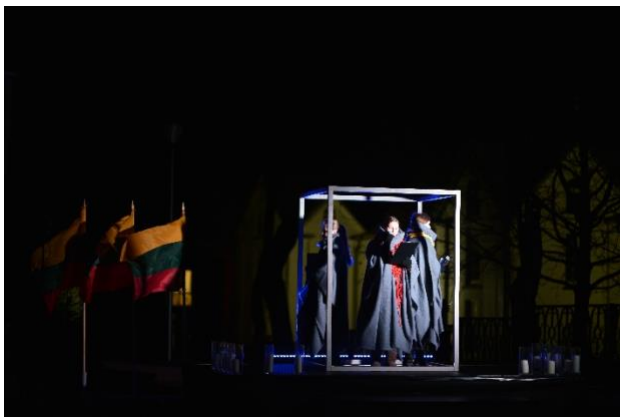
Radviliškio miesto kultūros centras

2008 metais Tarptautinė komisija pakvietė jungtis bendrojo ugdymo įstaigas prie iniciatyvos „Atmintis gyva, nes liudija“; idėją palaikė 47 Lietuvos mokyklos. Vėliau Tarptautinė komisija kreipėsi į įvairias institucijas ir organizacijas, kviesdama prisijungti prie idėjos – uždegti žvakutes languose dešimt minučių sausio 13 – osios rytą.