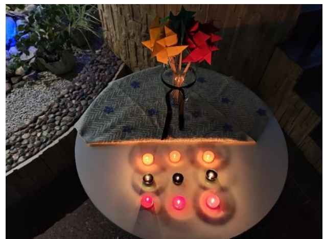
Pasvalio rajono Vaškų gimnazija