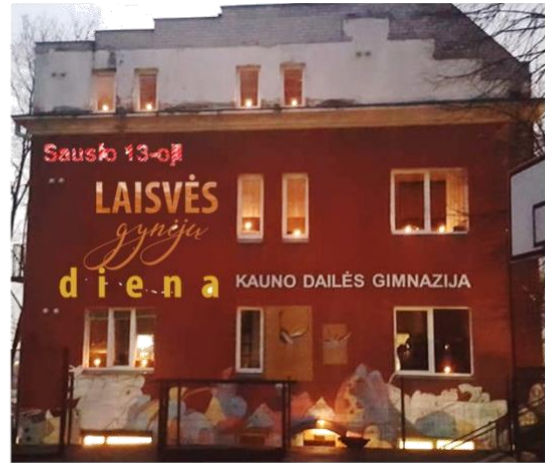
Kauno dailės gimnazija