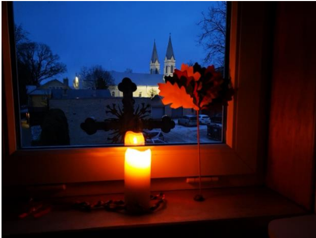
Pakruojis VŠĮ nevalstybinis katalikų lopšelis – darželis „Varpelis“