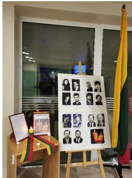
Lietuvos kariuomenės Dr. Jono Basanavičiaus karo medicinos tarnybos karių reabilitacijos centras