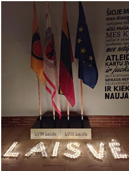
Akmenės rajono Ventos gimnazija