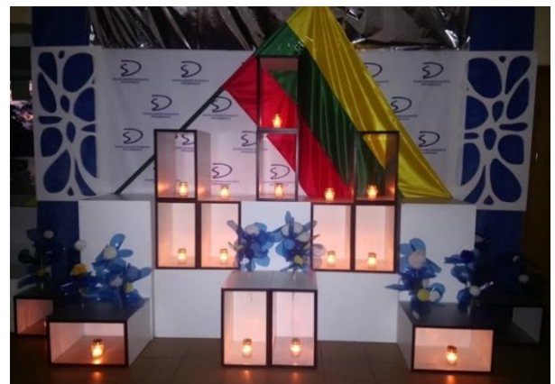
Kauno Simono Daukanto progimnazija